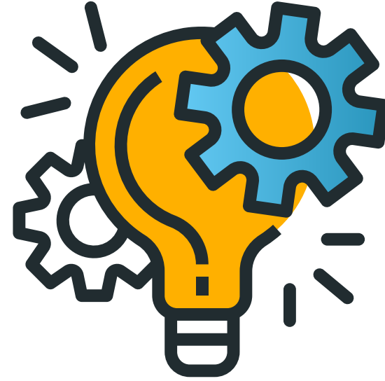
نظام إدارة متكامل