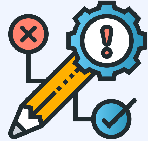
نظام إدارة تعلم