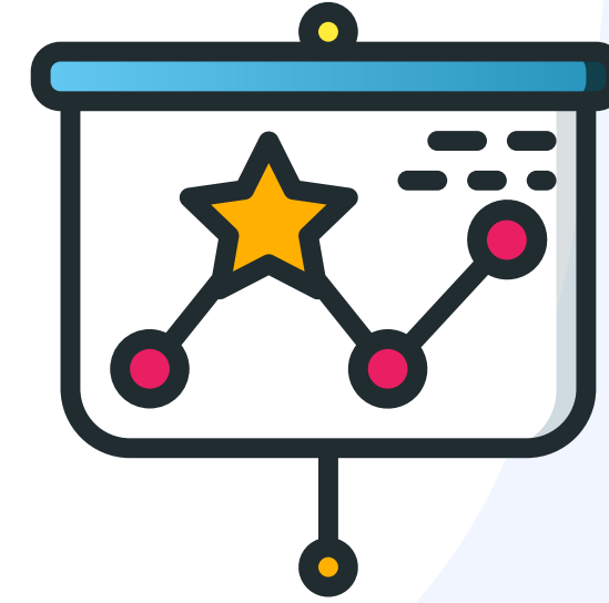
نظام ترويج متقدم